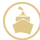
Mantenimiento de Puertos