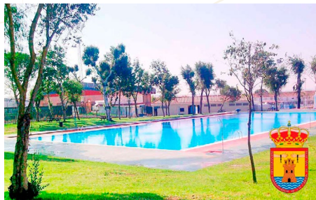
Mantenimiento y Socorrismo. Las Cabezas