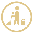
Servicios de Limpieza