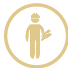
Gestión y desarrollo de obras e instalaciones