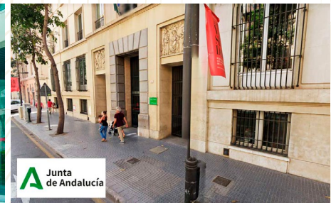
Delegación Salud y Familias Málaga