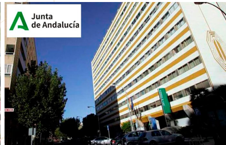
Mantenimiento Edificio Junta de Andalucía