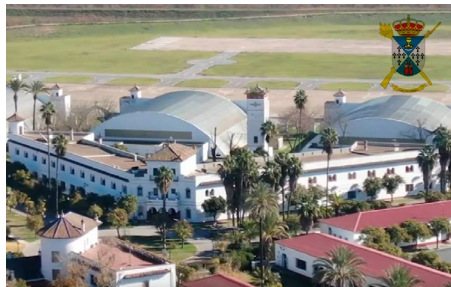
Sala de Compresores. Base El Copero