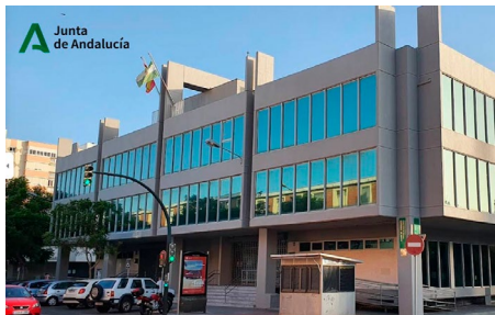
Unidad Valoraciones Médicas Cádiz

Realizamos la gestión integral de edificios e infraestructuras asegurando el confort de los usuarios, así como la seguridad y funcionalidad de las instalaciones.