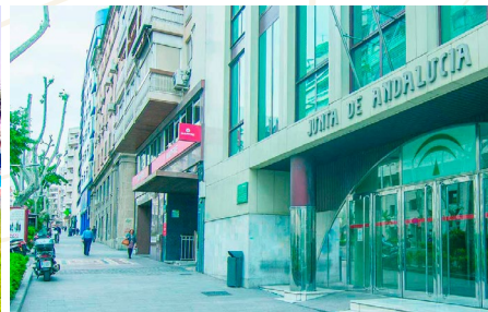
Mantenimiento y Gestión Técnica Junta And.