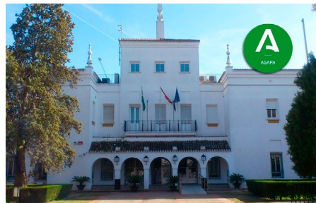
Sede AGAPA en Sevilla