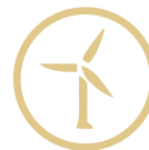
Gestión energética y medioambiental